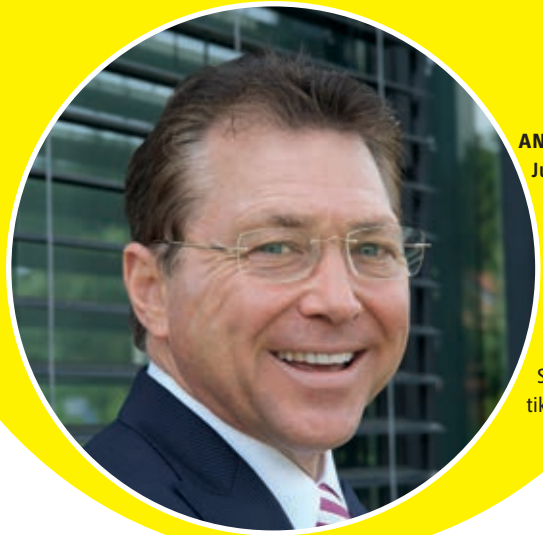
ANDRÉ WITSCHI Jury-Präsident Stiftungs- präsident Hotel- Fachschule Lausanne (EHL) und Präsident Schweizer Schule für Touris- tik, Passugg.